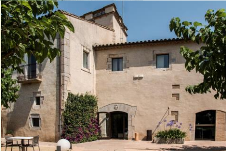
El Molí del Mig