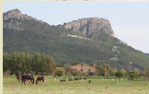
El Molí de Baix (mas la Galera)