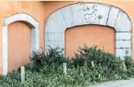
Portalada del Molí de Dalt amb l'escut dels comtes de Solterra