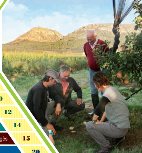
Família Aulet-Riera, Mas Llorers

Compartiu la fira a les xarxes: #FiraStAndreu